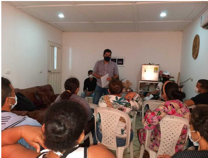
Figura 6 Formación en buenas prácticas agrícolas