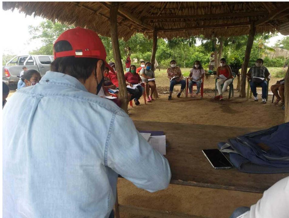
Figura 5 Proyecto Alianza productiva- Ministerio de agricultura