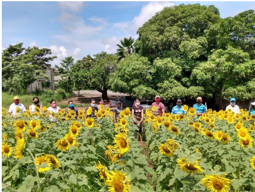
Figura 3 Proyecto Agencia de desarrollo rural (ADR)