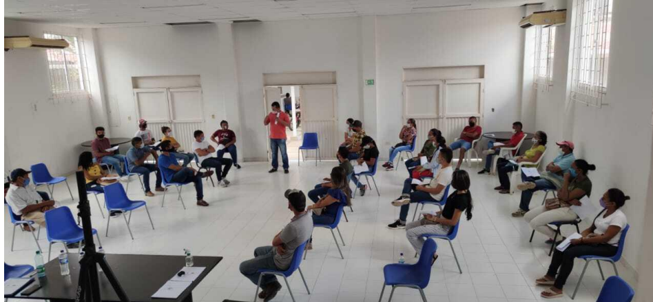
Figura 7 Capacitación en buenas prácticas agrícolas